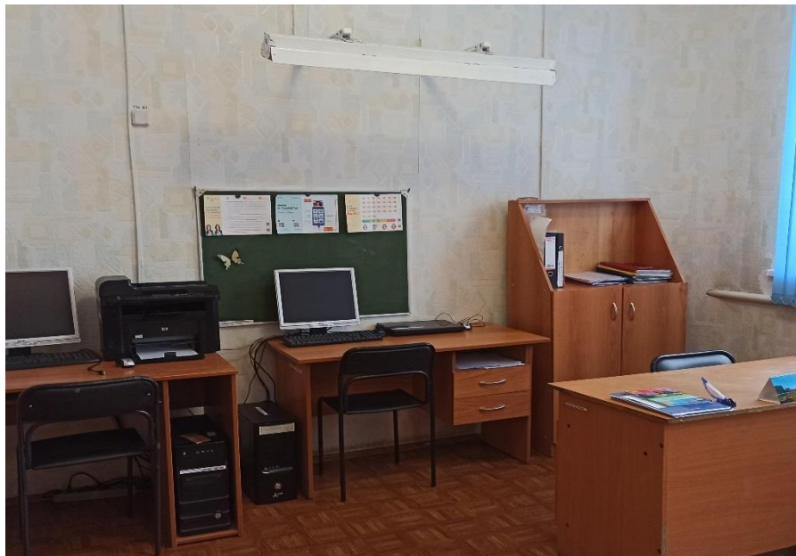
Кабинет для групповой работы